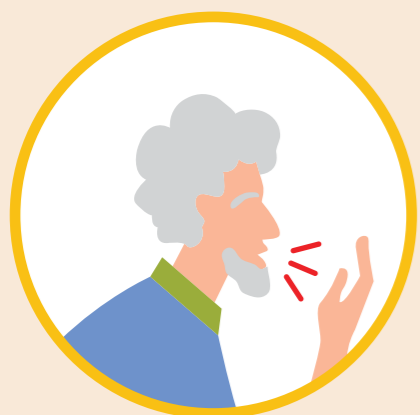
ГРИПП ОЧЕНЬ ЗАРАЗЕН