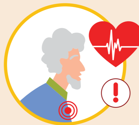
ВЫЗЫВАЕТ СЕРЬЕЗНЫЕ ОСЛОЖНЕНИЯ