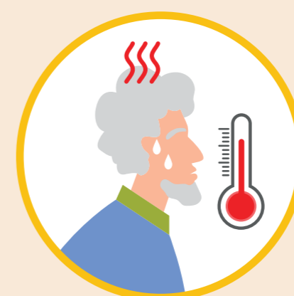
ПРОТЕКАЕТ НАМНОГО ТЯЖЕЛЕЕ ДРУГИХ ОРВИ

ОПТИМАЛЬНОЕ ВРЕМЯ ДЛЯ ВАКЦИНАЦИИ – СЕНТЯБРЬ – НОЯБРЬ.